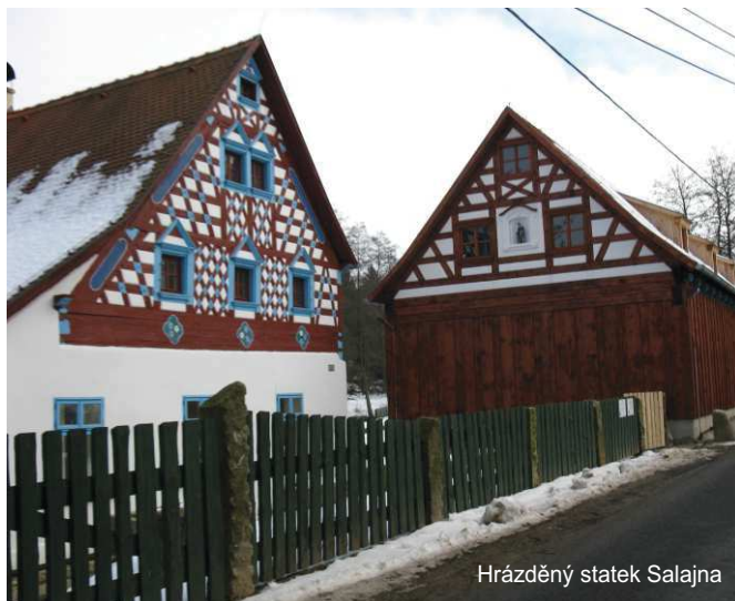
Hrázděný statek Salajna

V rámci Fiche 5 došlo k podpoře občanského vybavení v oblasti sociální a kulturní infrastruktury, péče o děti, vzdělání, zdraví, sportu, volnočasových aktivit. Fiche byla zaměřena na neziskové projekty obcí. Tato Fiche byla vyhlášena ve třech posledních Výzvách. Na MAS podalo Žádost o dotaci 27 žadatelů a dvanáct jich bylo proplaceno s celkovou dotací cca 4 855 000,- Kč.