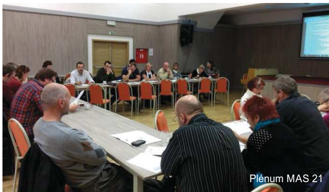
Plénium MAS 21

proběhlo jednání Pléna, nejvyššího orgánu MAS, v Plesné. Nejdůležitějším bodem jednání bylo schválení Strategie komunitně vedeného místního rozvoje na území MAS 21.