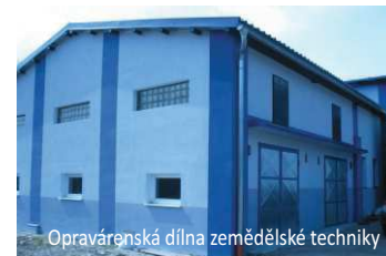
Oprávněnská dílna zemědělské techniky