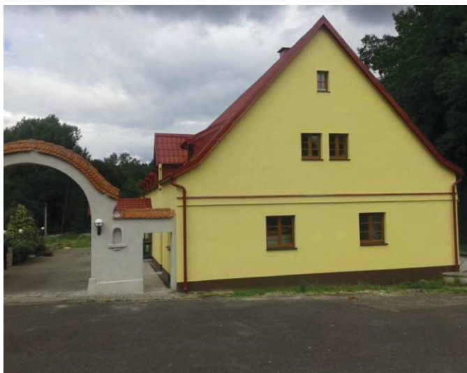
Ubytovací zařízení Pomezí nad Ohří