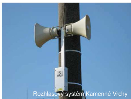
Rozhlasový systém Kamenné Vrchy

Projekty podpořené v rámci této Fiche přispěly ke zlepšení dopravní, technické, vodohospodářské infrastruktury v obcích a také ke zlepšení vzhledu obcí. Fiche 1 byla mezi roky 2009 – 2014 vyhlášena čtyřikrát. Na MAS bylo za celé období podáno dvacet Žádostí o podporu. U devíti z nich byla proplacena dotace v celkové výši cca 6.574.000,- Kč.