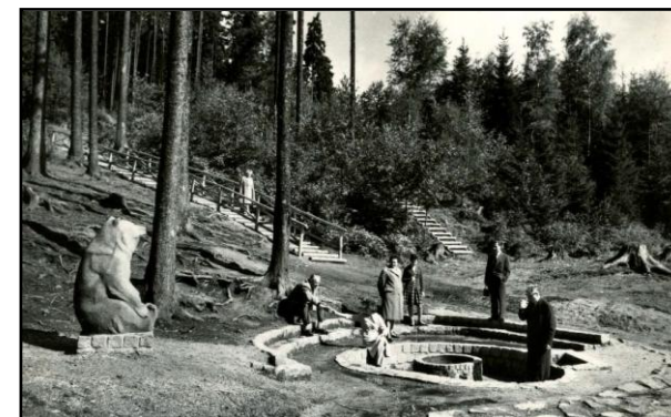
Medvědí pramen v 60. letech 20. století)